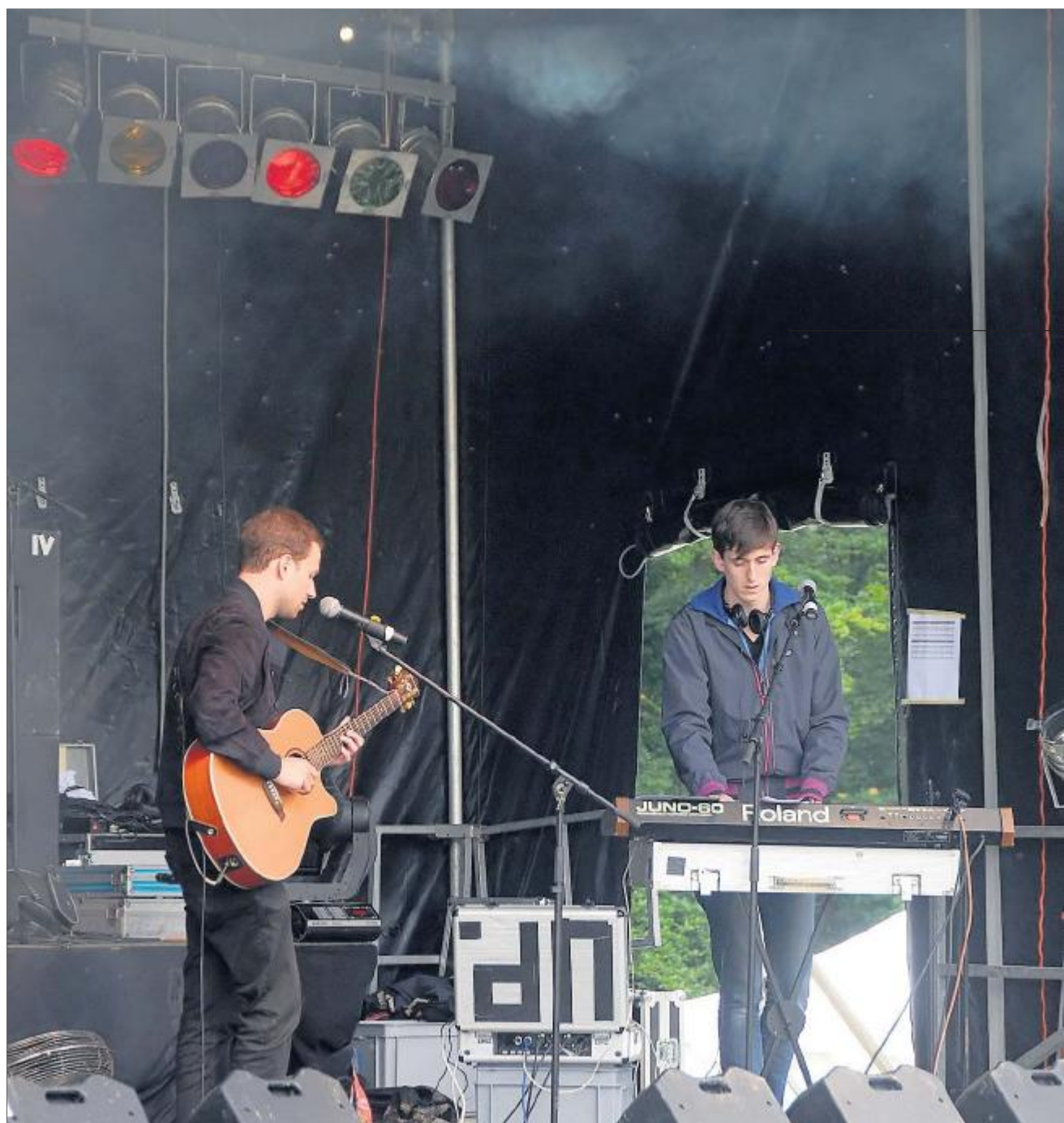
LEIMENTALER OPEN AIR Rund 1000 Musikfans feierten in Oberwil – die Band We Loyal gab auf der Bühne alles.

EIN TV IM BAR-ZELT sorgt dafür, dass auch die fussballbegeisterten Open Air-Besucher nicht auf die WM-Spiele verzichten müssen. Trotz der vorherrschenden Schafskälte und matschigem Boden finden sich am Samstag etliche Festivalbesucher in Oberwil ein und feiern vom Nachmittag bis in die frühen Morgenstunden hinein. Wer nicht schon dreckig ist, holt das nach, um eines von fünf TripleNine «Dräggig»-Alben zu ergattern, die Brandhärd an die fünf dreckigsten Besucher am Festivalende verschenkt.